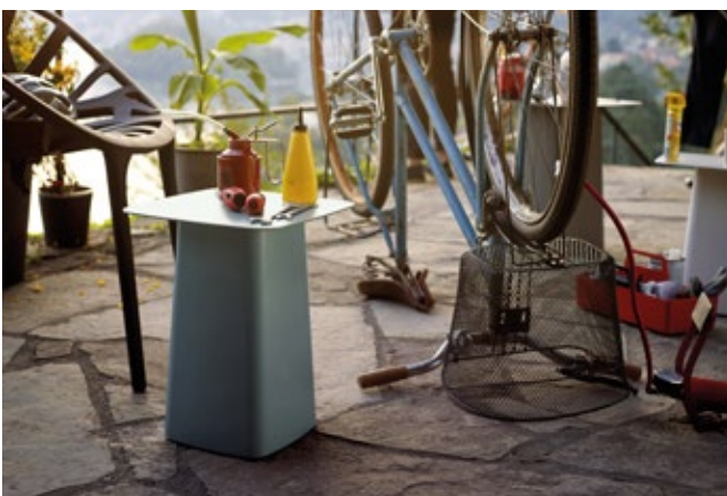
Metal Side Table (Outdoor)

In der pulverbeschichteten Variante mit Feinstruktur sind die Metal Side Tables wetterfeste Beistelltische. Sie lassen sich perfekt mit dem drinnen und draussen einsetzbaren Sessel Waver kombinieren, dessen Untergestell in denselben Farben erhältlich ist.